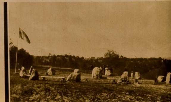
Bygden kring Stora Tuna kyrka med domarringen i förgrunden ; i cirkeln Dalarnas sigill instiftat år 1435; nedan stenarna på tingsplatsen vid Stora Tuna.

varit så betydelsefull även på den tiden, skulle vi nog inte haft någon Engelbrektsfejld eller anledning att fira Tuna Ting och tillkomsten av Sigillum Dala. Nu hampade det sig så, att Stora Tuna blev centrum i Sveriges ekonomiska hjärthygd, och följaktligen finga händelserna häruppe midsommarn 1434. Här intill kyrkan låg den gamla tingsplatsen, där bönder och bergsmän kommo »från sunnan och nordan till manliga rådslags fullbordan». Och efter Arboga möte, då man fått klart för sig, att »Danen, Juthen, Tysken och Jäkelen rådas alla Dala-socken», svälde kammaren på dem så pass kraftigt, att de beslöto skaffa sig ett eget sigill för att därmed bekräfta sina beslut. Försett med yxan och bågen prydde det åtskilliga högviktiga skrivelser under Sturarnas tid, då ting på ting höllos här. Så förlorades det och återfanns sent omsider i Finland, dit dalkarlarna under Sten Sture den äldres tid fört det med sig för att ha det till hands. Det ersattes av ett sigill med två korslagda trubbiga pilar, som sedermera blivit Dalarnas vapen och